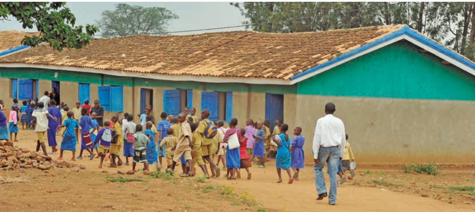
Escuelas de Mugina (Ruanda)